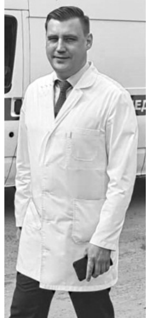
— В первую очередь я хочу пожелать всем здоровья! Оставайтесь такими же добрыми, отзывчивыми и человечными людьми! Беседовала Е. Карась

— Накануне Дня медицинского работника, что бы вы хотели пожелать своим коллегам?